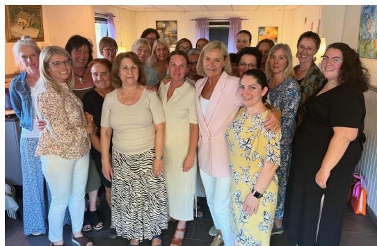
Nätverksträff våren 2023 på Peppes konditori i Lessebo tillsammans med Företagarna Växjö/Tingsryd/Lessebo och Nyföretagarcentrum i Kronoberg.