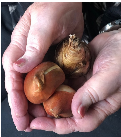
Bild: Lökplantering i Sjöglimtens trädgård