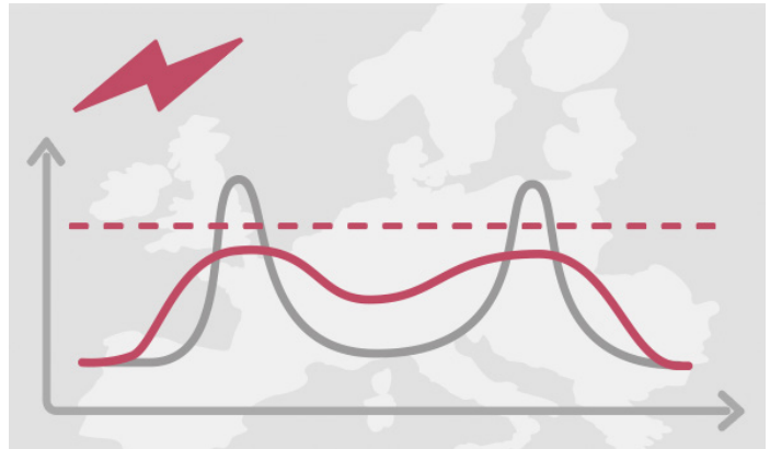
Bild: Jämna ut förbrukningen, från Energimyndigheten

Två procent motsvarar ungefär en grads sänkning av innetemperaturen i alla svenska bostäder. Både enkla tips och stora frågor om el hittar du på www.lessebo.se/energi