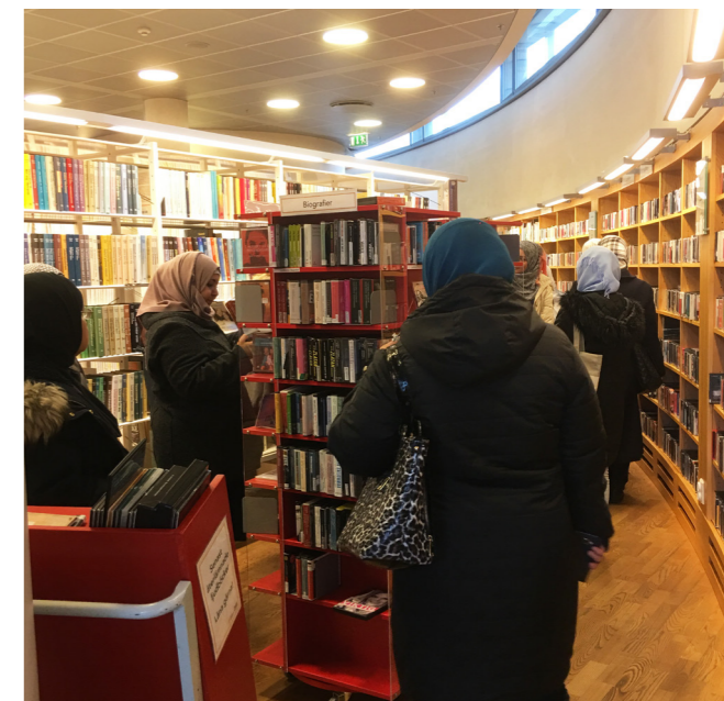
Deltagarna får kunskap bland annat genom studiebesök.

Resultaten i projektet har varit så positiva att flera kommuner i länet är intresserade av att starta liknande projekt. Tingsryds kommun står först på tur och kommer att jobba enligt samma koncept.