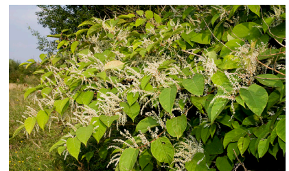
Se upp för parkslide, en växt som sprider sig snabbt och är svårt att bekämpa.