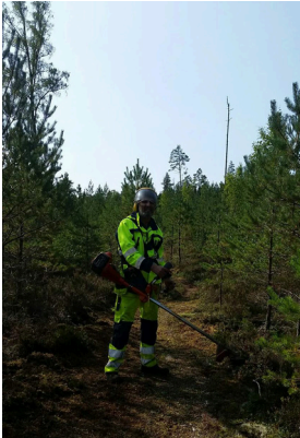
Nyligen har det röjts i området